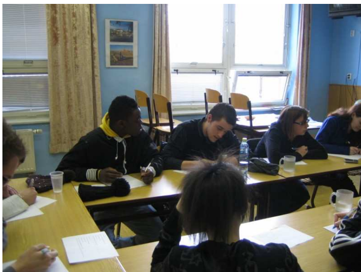
Francouzi - výuka