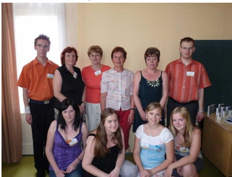
Družstvo našich studentů - vítězové