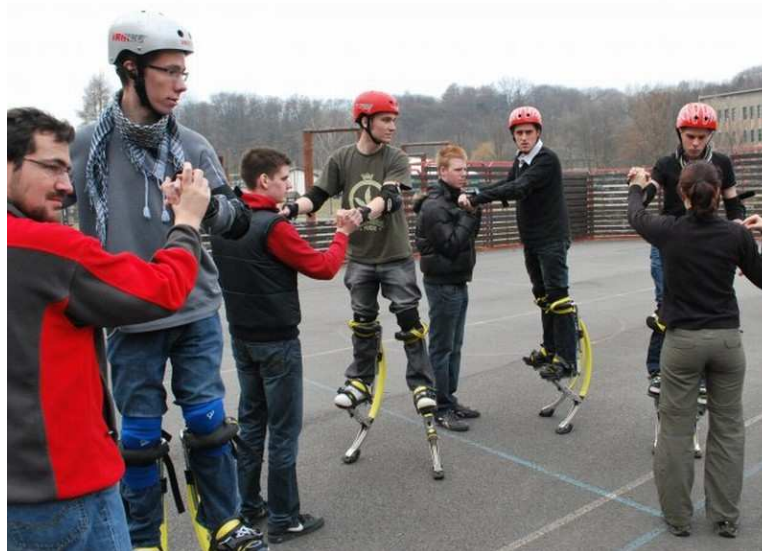
Francouzi – sportovní aktivita