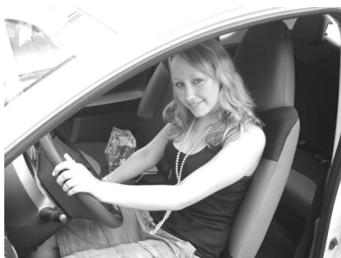
Žáci získávají řidičské oprávnění skupiny B zdarma.