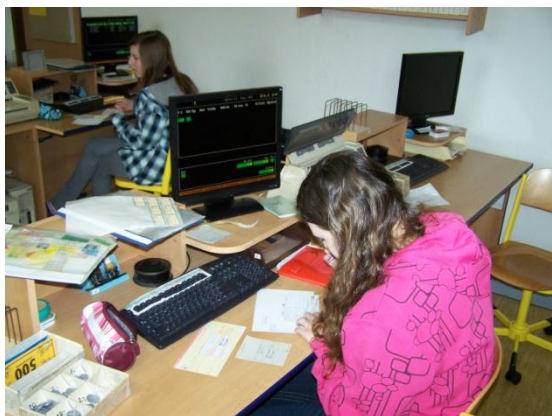
Žáci používají reálný firemní software.