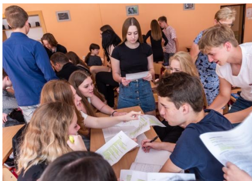
Při práci ve fiktivních firmách žáci získávají praktické dovednosti.