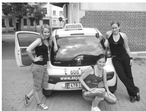
Žáci získávají řidičské oprávnění skupiny B zdarma.