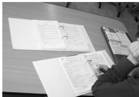
Žáci pracují s autentickými materiály pošty a finančních institucí.