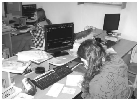
Žáci používají reálný firemní software.